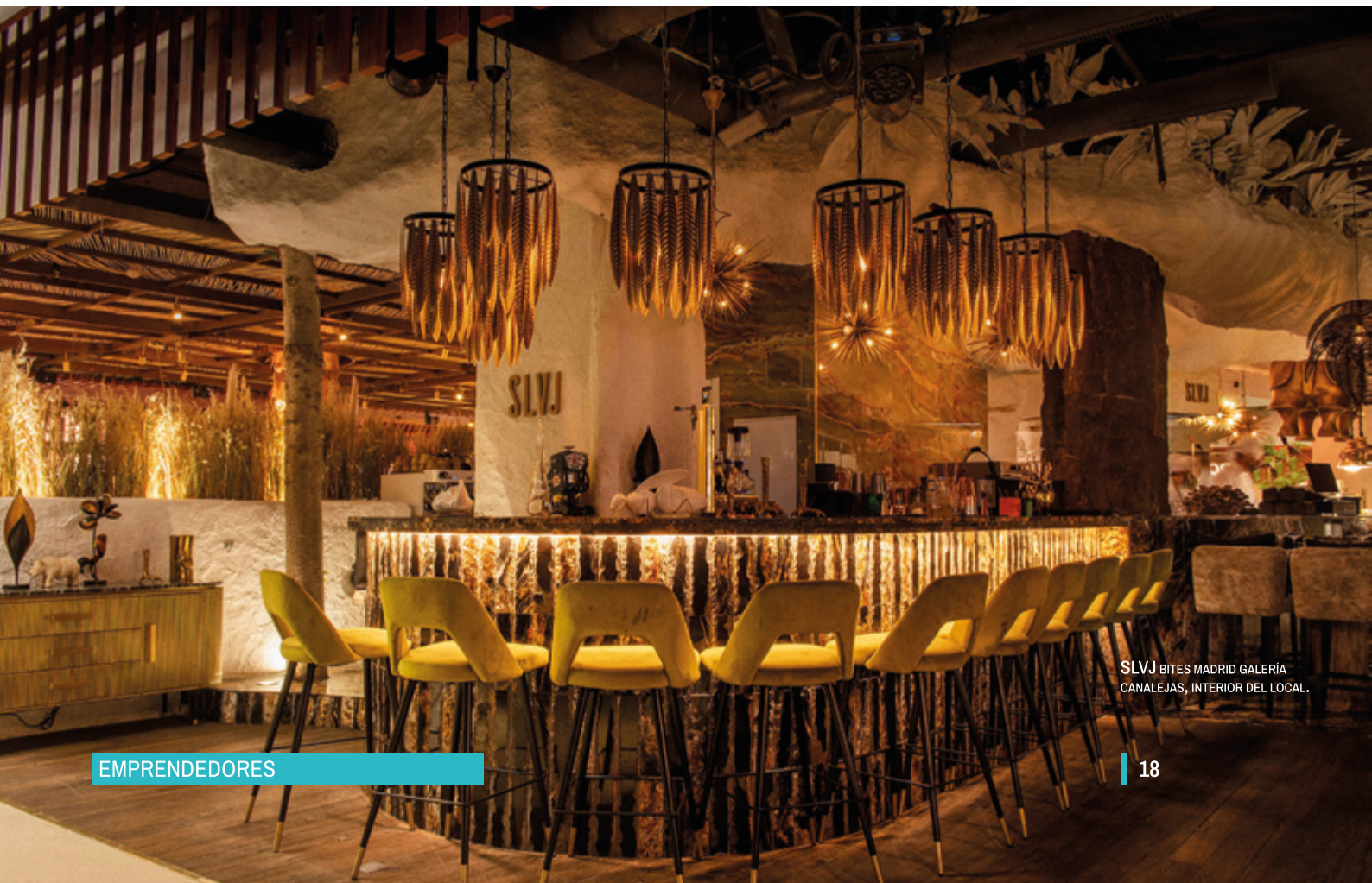
SLVJ BITES MADRID GALERÍA CANALEJAS, INTERIOR DEL LOCAL.

Además, en la era de las redes sociales, una experiencia llamativa puede convertirse en publicidad gratuita y totalmente orgánica. Los clientes comparten sus visitas en plataformas como Instagram , TikTok y Facebook , y amplían el alcance de la marca, atrayendo a nuevos consumidores interesados en vivir experiencias similares.