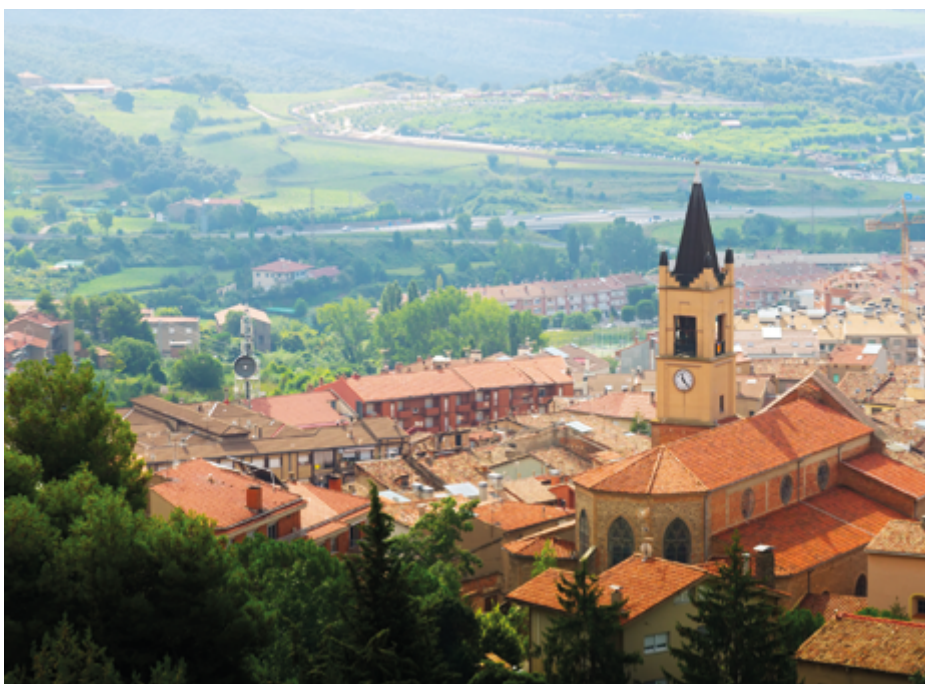
VISTA SUPERIOR DEL MUNICIPIO DE BERGA, CATALUÑA

Según el Instituto Nacional de Estadística (INE), en algunos municipios, se ha registrado un saldo positivo. Por ejemplo, la provincia de Soria, a menudo citada como ejemplo de la España vaciada, ha experimentado un ligero aumento de población en algunos de sus municipios más pequeños, un dato esperanzador, pero que debe interpretarse con cautela.