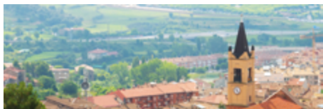
Tabla de contenidos